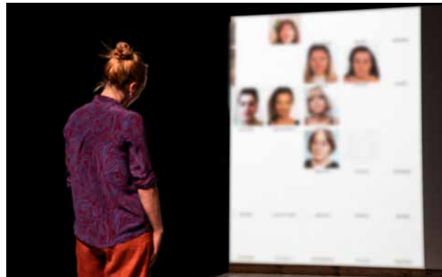
She was a Friend of Someone Else © Le Dandy Manchot

> 21 au 23 novembre à L'Idéal, Tourcoing