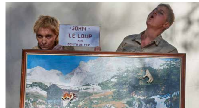
Quand les corbeaux auront des dents © Le Dandy Manchot