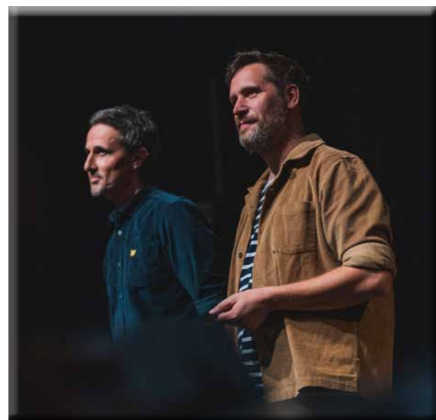
Kevin