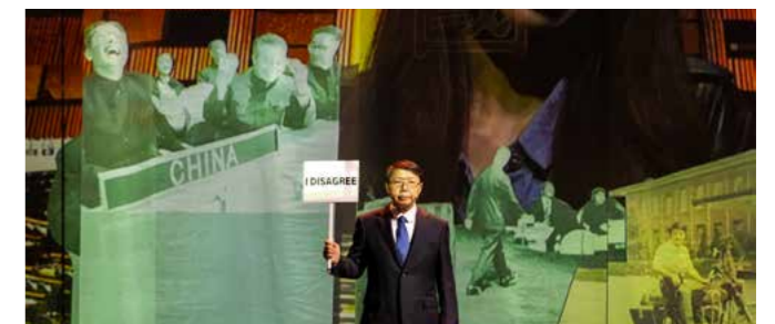
Ceci n'est pas une ambassade

> 28 nov., 20h30 au Phénix à Valenciennes