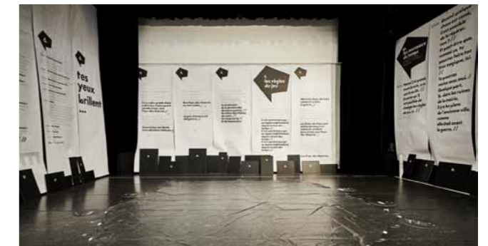
KiLLT - Les Règles du jeu

Se déployer dans les écoles, un objectif ambitieux qui nous anime depuis toujours et sera appliqué de manière aussi littérale que poétique cet hiver. Dans le cadre du dispositif « L'école buissonnière », le spectacle KiLLT sera joué dans plusieurs collèges et structures de Villeneuve d'Ascq du 10 au 13 décembre. Les équipes techniques et relations publiques de La rose des vents seront pleinement mobilisées pour transformer, le temps d'une journée, les espaces scolaires en lieu de représentation. Ce spectacle participatif, centré sur la lecture à voix haute, propose une scénographie singulière à la croisée des arts plastiques, de l'édition d'art et du théâtre. Il vise à désinhiber les élèves dans leur approche de la lecture à voix haute. Assister à ce spectacle vivant permet de pousser tout son corps au service d'un texte. La représentation ne peut advenir sans l'engagement des spectateur.rice.s, une belle leçon de solidarité.