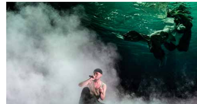
Love You, Drink Water