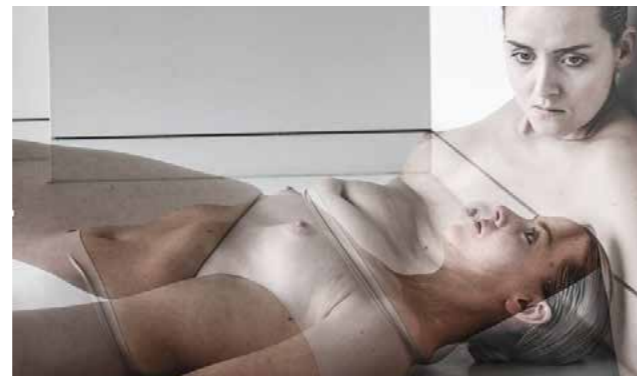
Motus Mori MUSEUM