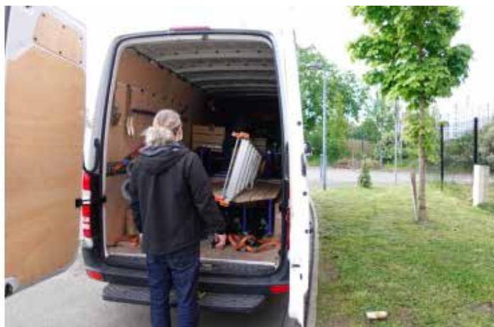
Équipe technique