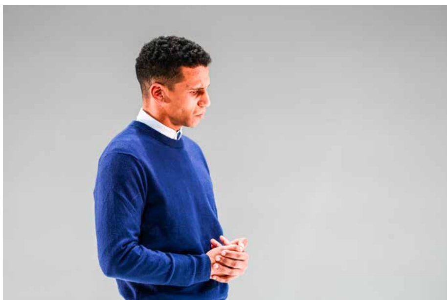
Le Mérite